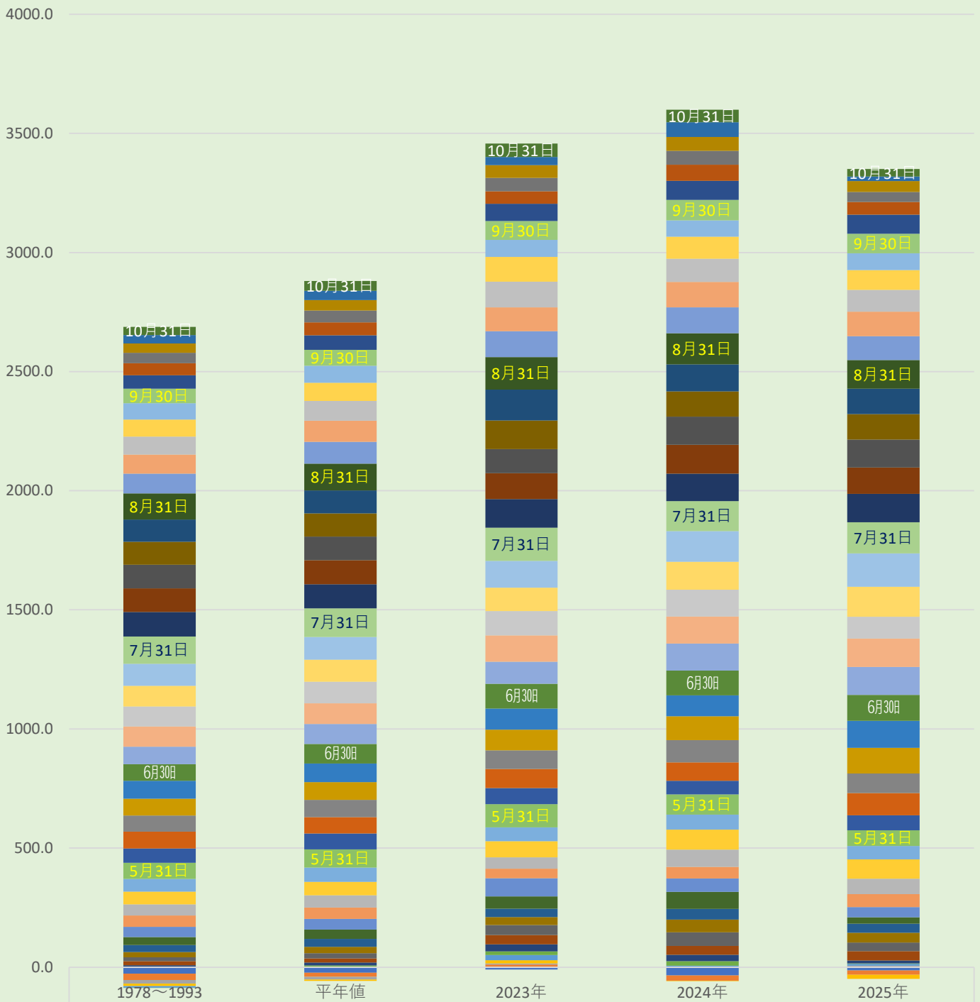
半旬積算気温グラフ